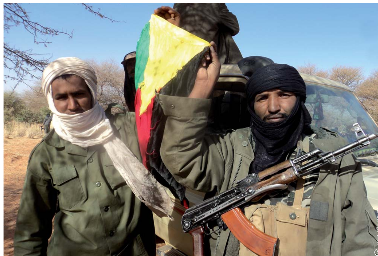
Toeareg met de vlag van de 'Republiek Azawad'.

2014: de situatie blijft zorgelijk: de jihadististen hebben zich teruggetrokken in het uiterste noorden, maar het lijkt erop dat zich strijders onder de bevolking bevinden; in het noorden vinden nog regelmatig aanvallen en ontvoeringen plaats. De Malinese staat en overheidsdiensten zijn nog niet volledig op orde. De regio wordt gekenmerkt door lokale conflicten. De vluchtelingen beginnen terug te keren. Maar er dreigt ook hongersnood voor 1,5 miljoen mensen. (Bronnen: WFP 3 maart, IRIN)