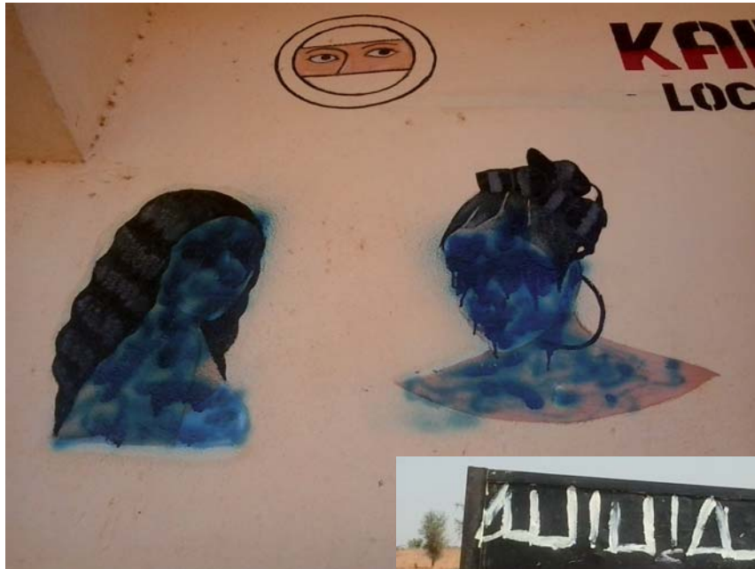
Boven: De vrouwengezichten op de buitenmuur van een bruidswinkel zijn beklad omdat het haram is menselijke figuren af te beelden.